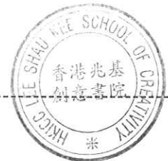
馮美華 香港兆基創意書院署理校長 二零零九年九月一日

香港兆基創意書院 2009-2010 學年《家長及學生信件》001C 號 (S.6 & S.7)